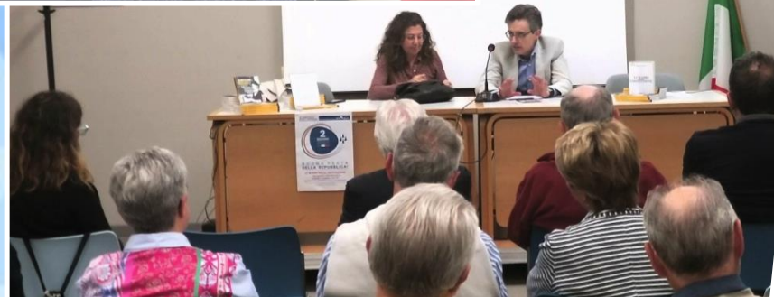
2023 - Presentazione del libro 'Le madri della Costituzione'